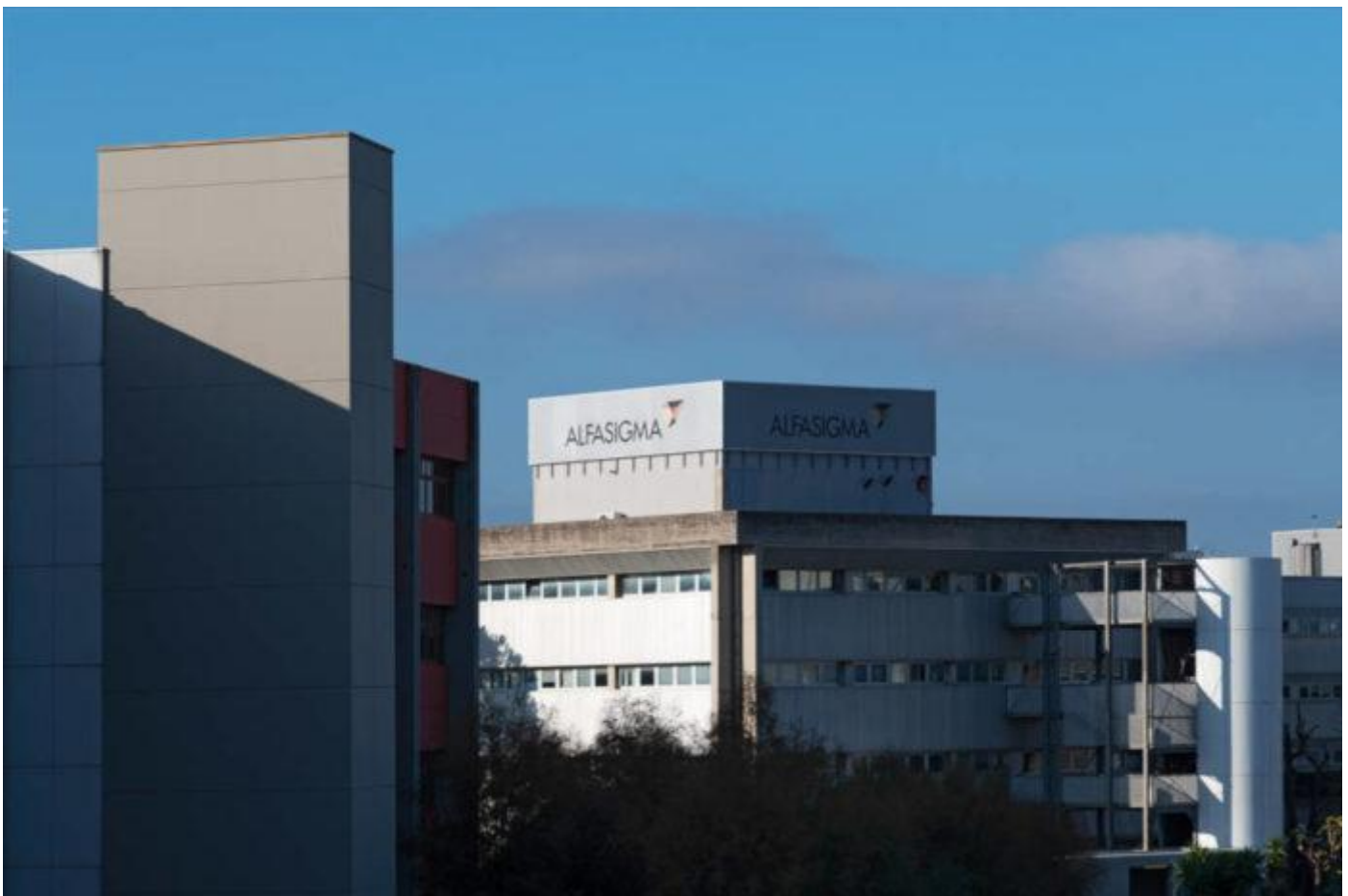
Alfasigma Pomezia